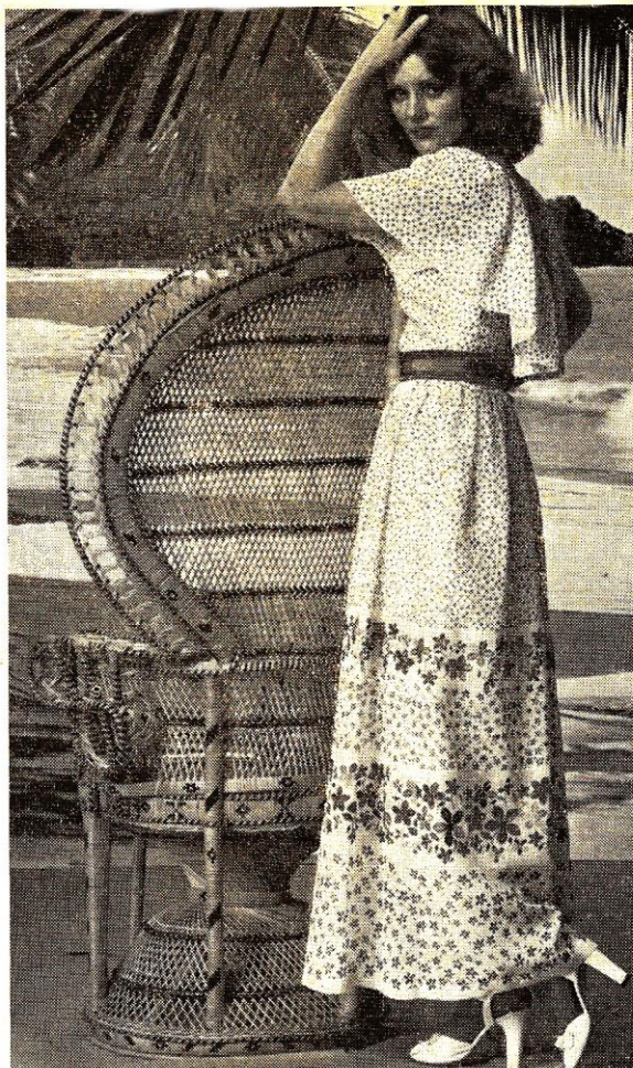
5. ábra. Nyomottminta szabadiidőltözék

lalat megoldotta az antisztatikus charmeuse kelme nyomását és kísérleteket folytatott velúr kelméink nyomására is. Bár a kísérleti stádiumon ez utóbbi kelmefajtánál nem jutottak túl, remény van arra, hogy 1978-ra ez is megoldódik. Ezzel párhuzamosan tárgyalásokat folytatunk egy jugoszláv gyárral, hogy esetleg ott gyártanának számunkra, bér munkában, nyomott velúrt. A termelés ebben a kooperációban 1978-ban megindul.