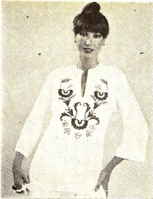
1. ábra. Körkötött kelméből készült blúz

A Nova-Knit által rendelkezésünkre bocsátott know-how alapján gyártott felsőruházati kelme igen alkalmasnak bizonyult öltönyök gyártására is, amit az is bizonyít, hogy az 1977. évi Őszi BNV-n a „Dávid” elnevezésű öltöny a BNV díját nyerte el. Nagyüzemi gyártását Kiskunfélegyházán, V. számú gyáregységünkben 1978-ban kezdik meg.