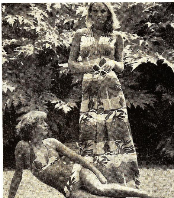
6. ábra. Nyomottminta fürdőruha és strandruha

Mivel ez a lehetőség igényeinket már nem elégítette ki és a mintaláncok beszerzése igen nagy anyagi terheket rótt a vállalatra, szükségessé vált a saját