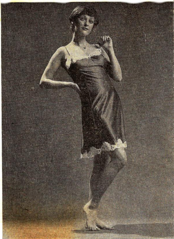
4. ábra. Antisztatikus poliamid kombiné