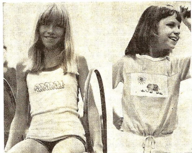
3. ábra. Patilon trikó és blúz

Vállalatunk a Magyar Viscosagyárral közösen elvégezte az első próbagyártásokat, és azok alapján a Magyar Viscosagyár megtette a lépéseket a nagyüzemi gyártás bevezetésére. Ez 1978-tól kezdődően valószínűleg meg is történhet. Az antisztatikus fonalak használatát kiterjesztettük az iskolaköpenyekre is, bemutattuk az ilyen kelméből készült köpenyeket és azok kereskedelmi partnereink tetszését megnyerték. Az értékesítés 1978-tól megkezdődik.