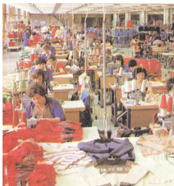
Varroda a zuglói gyárban

kesítése megmaradt a BFK hatáskörében, a sikkötött termékek azonban veszteségessé váltak, ezt az üzletágat a gépekkel, a forgóeszközökkel és a rendelésállománnyal együtt 1989-ben eladták a Loretta Kft.-nek, amely 90 volt BFK-dolgozónak biztosított munkalehetőséget.