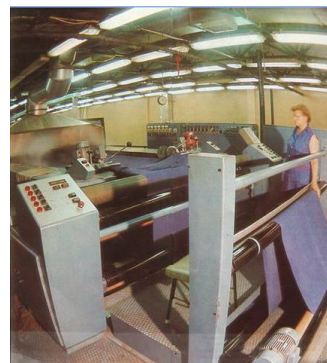
Hőrgyújtógép a rákos-palotai gyárban