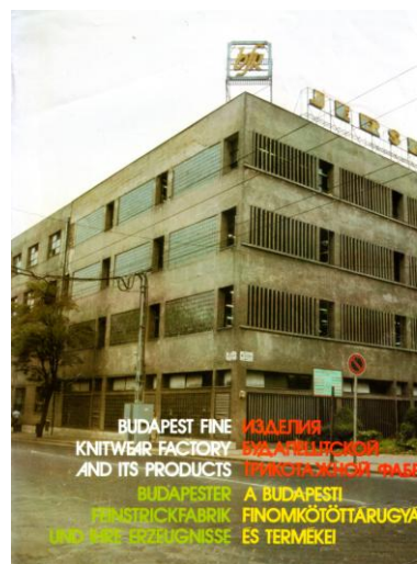
A Szugló utcai gyár a BFK főnökürelében