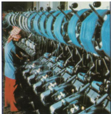
Csévélőüzem a debreceni gyárban

A textilipari rekonstrukció keretében, az 1970-es években a BFK számos korszerű, új kötő-, színező-,