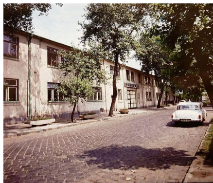
A Hungária Jacquardszövőgyár egykori épülete Kispesztben [11]