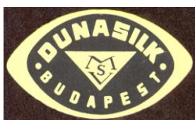
Az MSV emblémája

A Magyar Selyemipar Vállalat (rövidített nevén: „MSV”, a vállalatot külföldön – márkaneve alapján – „DUNASILK” néven ismerték) hét akkor fennálló selyemszövődéből, két cérnázógyárból és egy selyemkikészítő gyárból 1955.