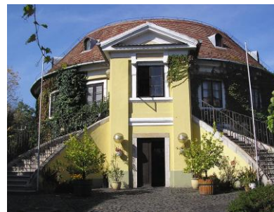
Az óbudai Selyemgombolyító emléklék épülete [11]