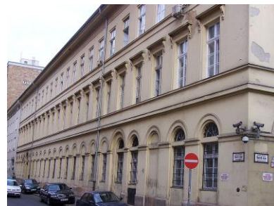
A volt Valero Selyemgyár épülete a mai budapesti Markó utca és Honvéd utca sarkán (müemlék) [11]

A Magyar Selyemipar Vállalathoz csatolt gyárat Duna Cérnázógyár néven szintetikus (poliamid és poliészter alapú) fonalak gyártására specializálták. E célra akkor igen korszerűnek számító gépekkel szerelték fel és ezzel a gyár jelentős mértékben hozzájárult a hazai szövő- és kötőipar fonaellátásához a terjedelmesített fonalak körében.